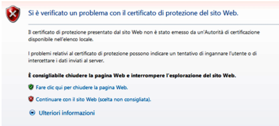
Figura 4: Certificato non valido su Explorer

Cosa fare in presenza di queste segnalazioni? Le azioni da compiere dipendono da diversi fattori dipendenti sia dal motivo della segnalazione di non validità sia dalle competenze tecniche dell'utente. Possiamo ricondurre i motivi di segnalazione di mancata validità di un certificato ai seguenti casi: