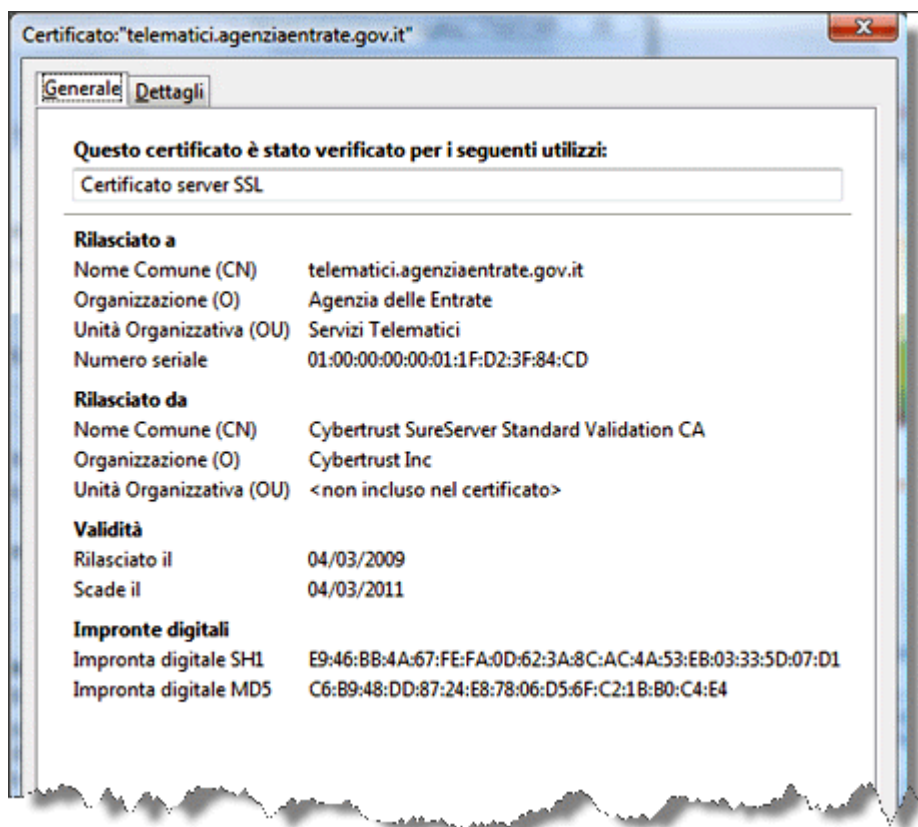
Figura 1: Un certificato dell'agenzia delle entrate

I dati principali contenuti nel certificato indicano: